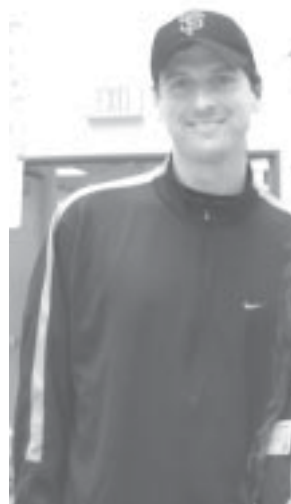
El alcalde de San Francisco, Gavin Newsom visitó los talleres y exposiciones de la Conferencia.